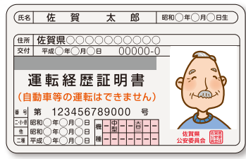
●運転経歴証明書見本